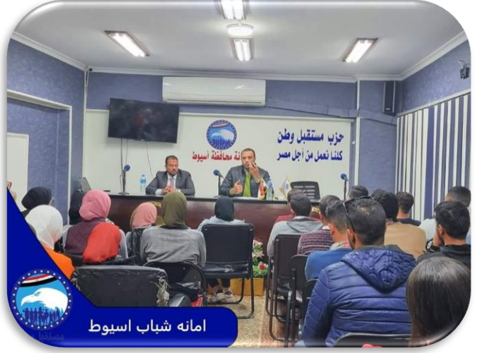
امانه شباب اسيوط