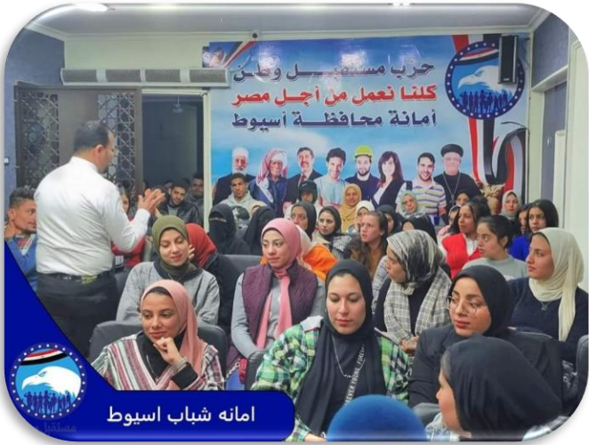
امانه شباب اسيوط

عقدت أمانة الشباب بالمحافظة ، دورة تدريبية، تحت عنوان "كن قائداً" وذلك لتأهيل الشباب للمناصب القيادية والعمل بروح الفريق لرفع كفاءة شباب الحزب بمنهج علمي منظم بحضور أعضاء هيئة مكتب الأمانة وشباب الحزب.