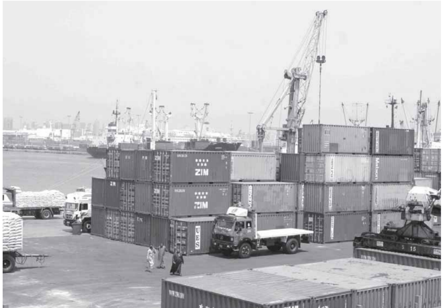
كتب - نسرين أبوالمجد

العالمية، والتدخل كلاعب قوى في إحداث التوازن داخل السوق خاصة في حالة وجود عجز أو نقص في سلعة ما. «روزاليوسف» فتحت ملف ودور شركات قطاع الأعمال كأحد الحلول في مواجهة الأزمة العالمية الراهنة.