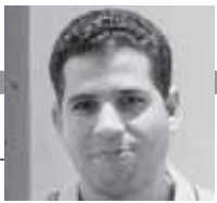
محمود عبدالله تهاوي

قبل عامين من وفاته، أي في سن الرابعة والثمانين من عمره، شعر المفكر الدكتور حسن حنفي (1935-2021) بالانزعاج الشديد من ملاحظة دور النشر معه، وتباطؤهم في دفع الحقوق المالية لمؤلفاته بشكل جزئي أو بشكل كامل، إلى جانب تعاقب عدد من العاملين لديه بالمنزل كمساعدين أو سكرتارية، للرد على المراسلات، وإعداد أوراق المؤتمرات، وكتابة الفصول والأبواب للمؤلفات. لم يتصفوا بالأمانة بل وصل الأمر إلى حد «الاحتيايل والنصب» على المفكر الكبير.