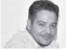
سامح فايز يكتب: