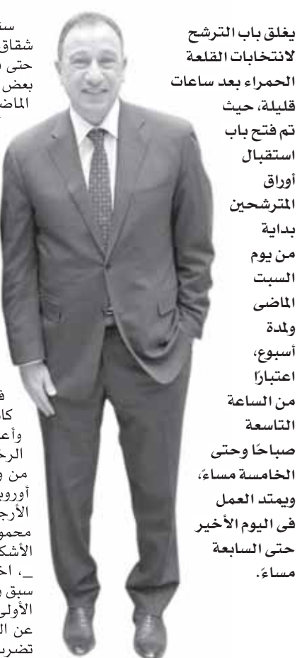
يغلق باب الترشح لانتخابات القلعة الحمراء بعد ساعات قليلة، حيث تم فتح باب استقبال أوراق المرشحين بداية من يوم السبت الماضي وليلة أسبوع، اعتباراً من الساعة التاسعة صباحاً وحتى الخامسة مساءً، ويبدأ العمل في اليوم الأخير حتى الساعة