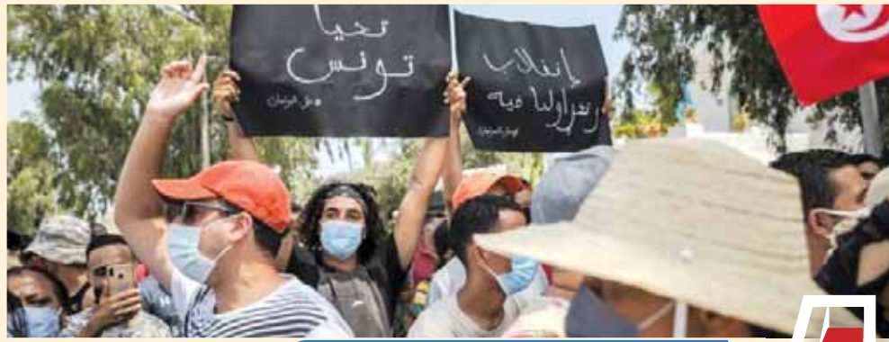
الأزمة الليبية والقضية الفلسطينية

خلال المؤتمر الصحفي للرئيس التونسي قيس سعيد مع الرئيس عبد الفتاح السيسي بعد قمة القاهرة في إبريل الماضي، أكد الرئيس التونسي فيما يتعلق بقضية سد النهضة «أن الأمن القومي لمصر هو أمننا وموقف مصر في أي محفل دولي سيكون موقفاً، ولن نقبل أبداً بأن يتم المساس بالأمن المائي لمصر». رسالة ترجمتها القيادة التونسية فعلاً، في يوليو الماضي بمجلس الأمن، حينما قدمت تونس، باعتبارها عضواً بمجلس الأمن حالياً، مشروع قرار يدعم الحقوق المائية لمصر والسودان ويدعو في المقابل الجانب الإثيوبي للتوقف عن ملء خزان سد النهضة وتشغيله دون اتفاق قانوني ملزم بين الدول الثلاثة، داعياً لاستئناف المفاوضات حول السد تحت مظلة الاتحاد الإفريقي، للوصول في غضون ستة أشهر، إلى نص اتفاقية ملزمة لملء السد وإدارته. مشروع القرار التونسي الداعم لموقف مصر والسودان،