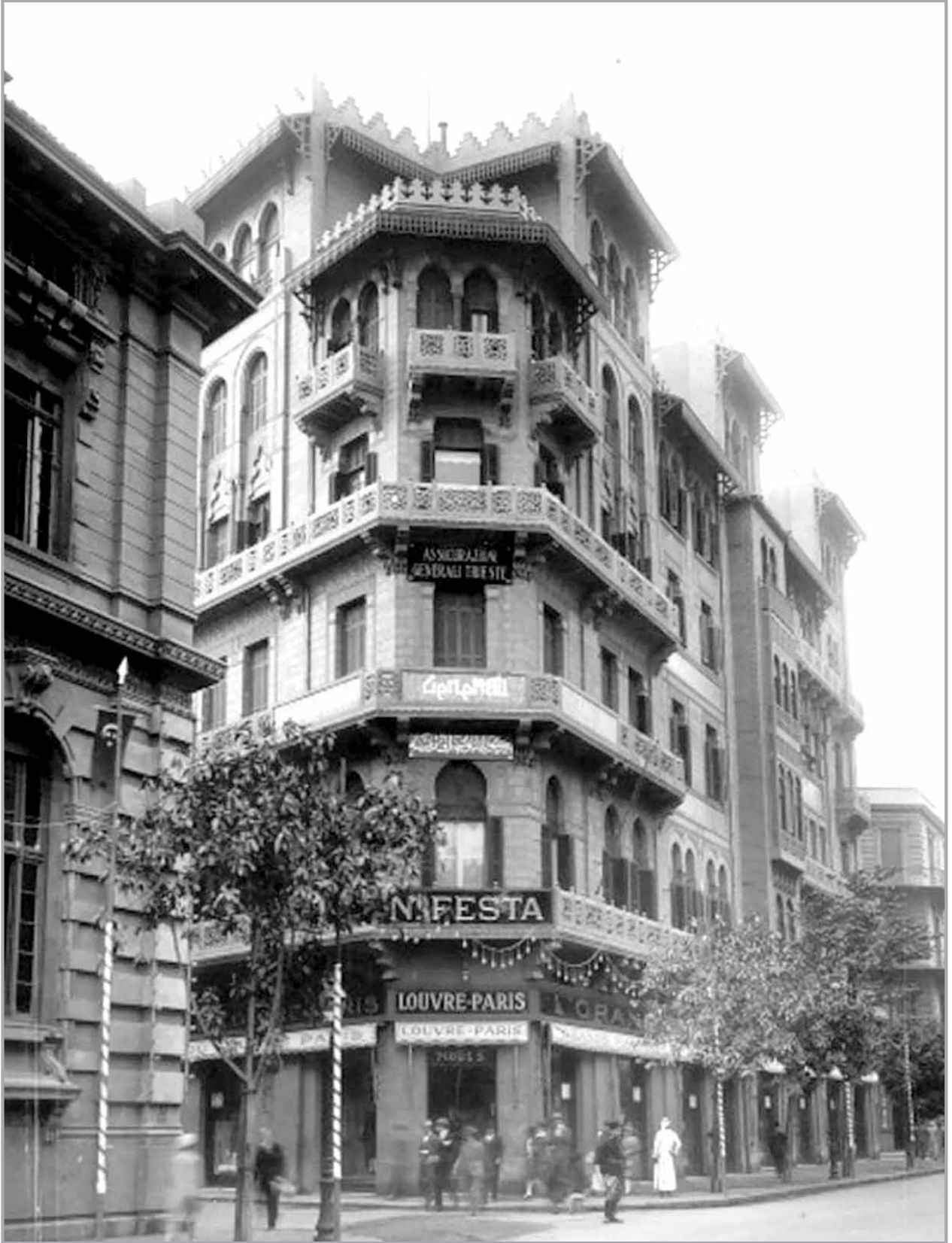
شارع طلعت حرب في الثلاثينات