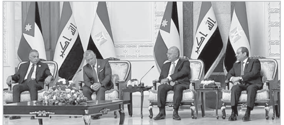
جانب من فعاليات اللجنة الثلاثية بين مصر والعراق والأردن

« 20% زيادة فى صادرات مصر للعراق و32% فى صادرات ليبيا.. و14% فى صادرات السعودية