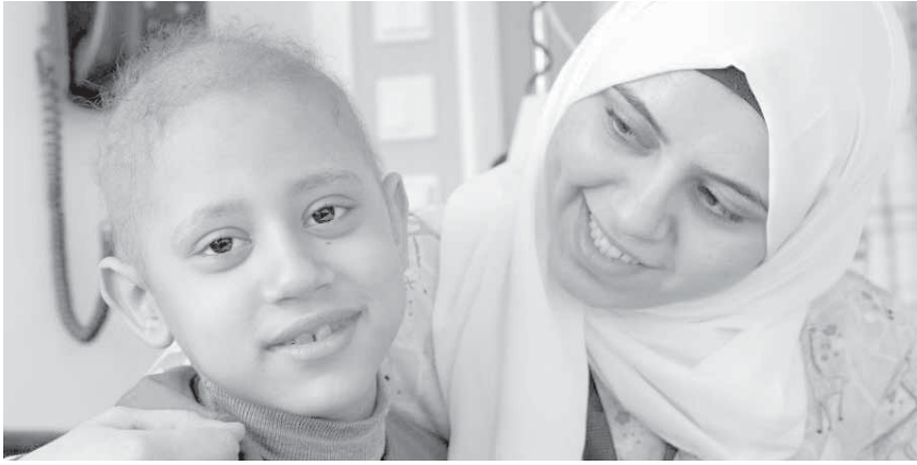
اضحك.. الصورة تطلع حلوة

لا يقتصر دور التمريض في مستشفى 57357 على تقديم الرعاية الطبية فقط، بل يحرص المسؤولون في المستشفى على أن تكون جودة التعامل وإنسانيتها إحدى صفات الممرضة العاملة. فالتعامل مع الأطفال له طبيعة خاصة، وبمجرد دخولك 57357، سيضفت نظرك العنصر النسائي يرتدين زياً مميزاً ومبهجاً، كأنه لوحة فنية مرسومة، وعندما تلتقي إحداهن، فعليك أن تعرف أنها أحد أفراد فريق التمريض بالمستشفى، الذي يتميز بالتعلم المستمر، والمهارة اللازمة، وتقديم رعاية طبية بأعلى جودة.