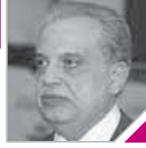
اللواء عبدالحميد خيرت