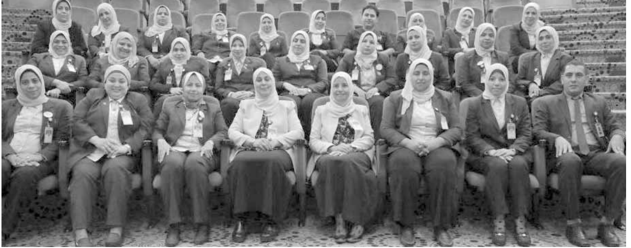
فريق التمريض خلال أحد التدريبات

الأقسام العادية، وهذا يتحدد من خلال تقييم المهارات الخاصة وقدرات كل ممرضة فى التعامل مع الحالات المختلفة.