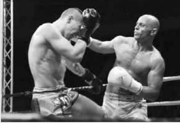
أبو ستيت فاز بالنهاى