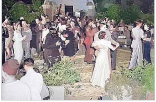
حفلات الرقص الرومانسى ..