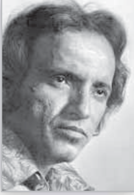
بليغ حمدى المتعة الموسيقية