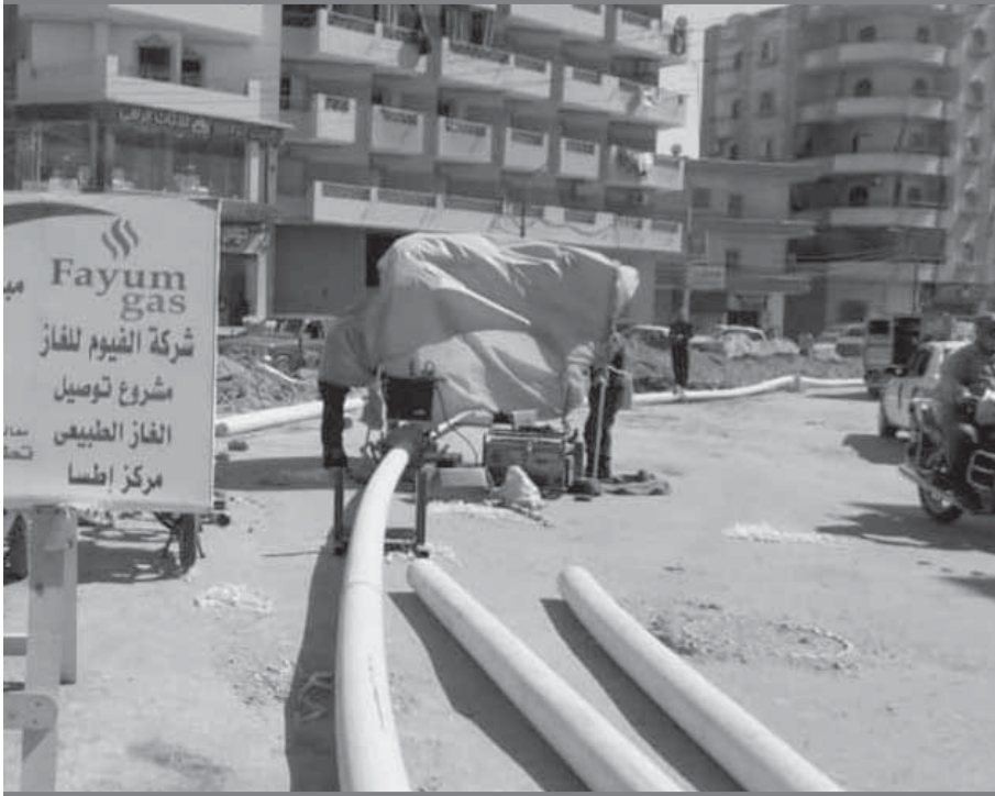
بدء أعمال توصيل الغاز الطبيعي لمركز اطسا بمحافظة الفيوم

تواصل الدولة جهودها لتطوير قرى مختلف المحافظات فى الوجيهين القبلى والبحرى، ضمن مبادرة «حياة كريمة»، من خلال إقامة مشروعات البنية التحتية والخدمات والمبادرات الاقتصادية لتوفير فرص العمل، إضافة إلى تطوير منازل الفئات الفقيرة والأولى بالرعاية والتدخلات الاجتماعية والصحية العاجلة، مثل تقديم المساعدات المادية والقوافل الطبية.. وتنمية هذه القرى بشكل مستدام.