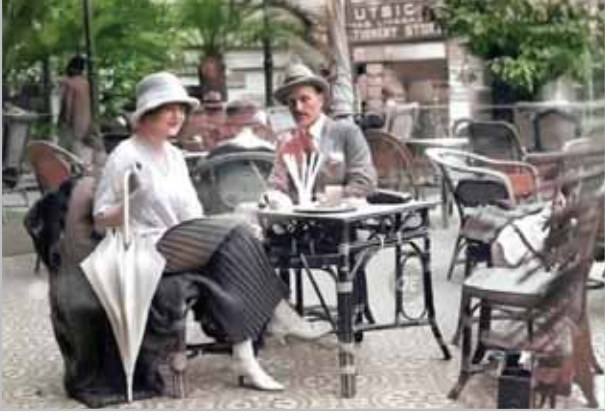
قعدات الأجانب زمان