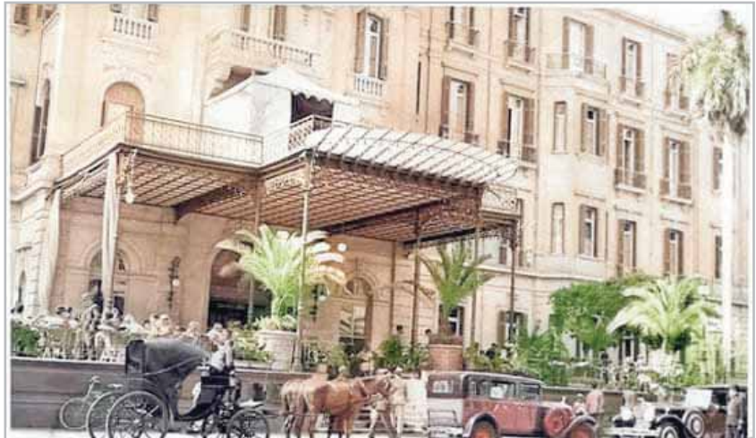
فندق شبرد القديم فى الثلاثينيات

وأبدى العمارى الشهير ميشيل باخوم تحفظه كذلك على التصميم، وحذر السكان من خطر الزلازل وتأثير الرياح على المبنى، لكن العمارة تحددت كل المخاوف والتحذيرات، ولا تزال قائمة فى مكانها بعدما تكلفت وقت بنائها 300 ألف جنيه، وهى 35 طابقا، كل طابق