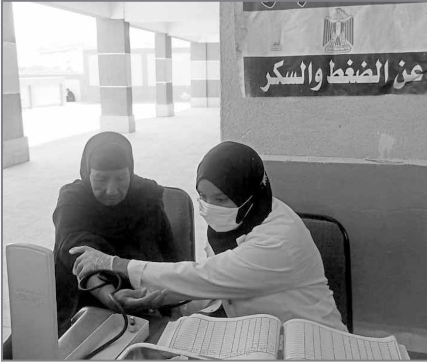
الكشف عن الأمراض المزمنة وتوفير الرعاية الطبية

« 1238 مشروعاً في 181 قرية و1123 نجعاً وتابعاً بسوهاج.. و125 مدرساً « 686 مشروعاً بتكلفة 10.2 مليار جنيه في الفيوم.. و1616 مشروعاً في 66 قرية و218 « تطوير وإنشاء 91 مكتباً بريدياً مزوداً بماكينات الصراف الآلي.. و165 مشروعاً لإنشاء وتجديد