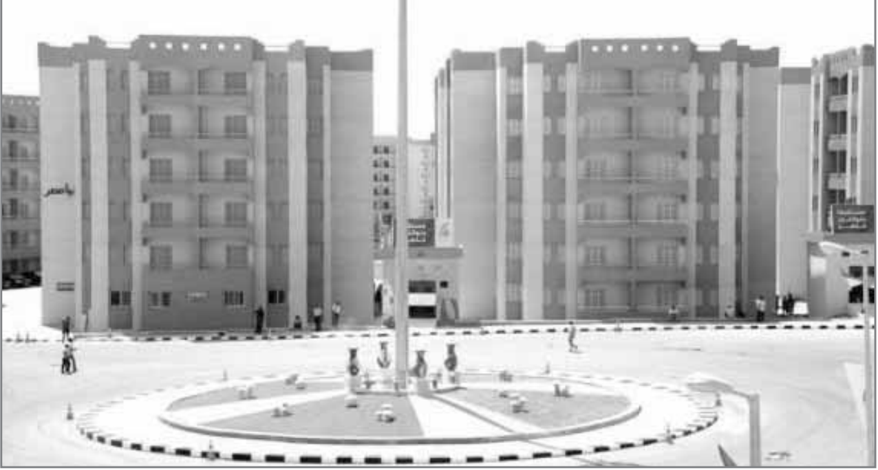
توافر السيولة لمشروعات الدولة والتمويل دون الاستدانة

وأشار معيط إلى ضوابط قيد الصكوك المصدرة فى السوق المحلية ببورصة الأوراق المالية، وسيتم حفظها بشركة الإيداع والحفظ المركزى، وسيتم قيد الصكوك المصدرة بالأسواق الدولية الصادرة بالعملات الأجنبية بالبورصات الدولية، وفقاً للقواعد المتبعة للإصدارات الحكومية الدولية.