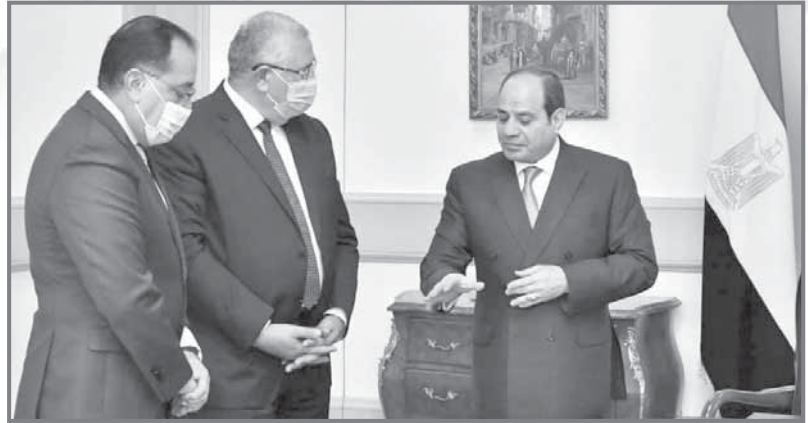
توجيهات رئاسية بالتوسع فى استغلال الأمطار فى الزراعة