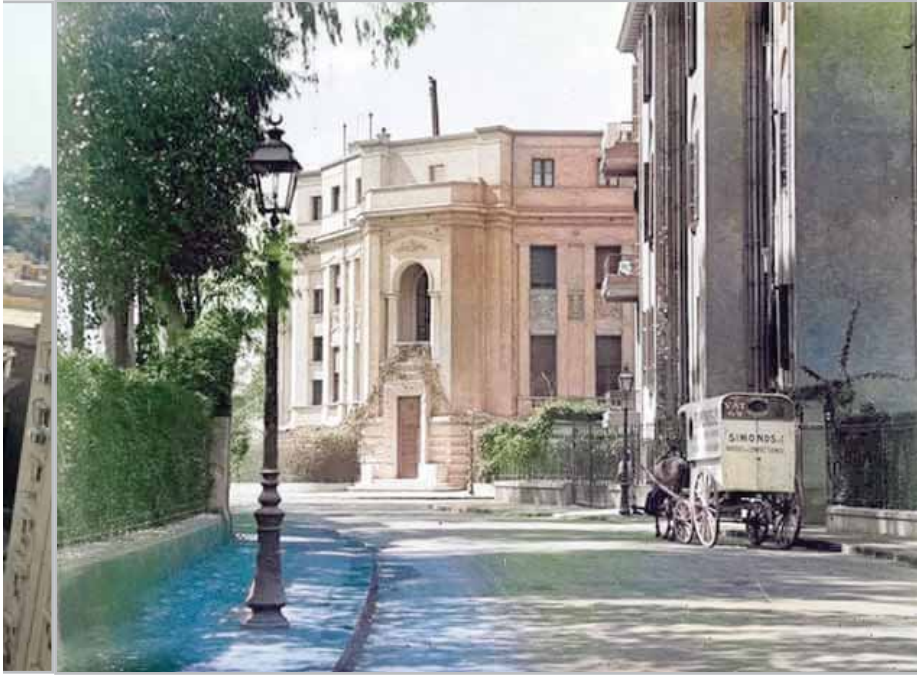
اجمل القصور في جاردن سيتي

«جاردن سيتي»، أحد أهم الأحياء في القاهرة، سكنه الملوك والأمراء، وكبرى العائلات، وهو أول الأماكن المغلقة على فئة معينة حيث استوحيت منه فكرة «الكمبوندات». «حي جاردن سيتي» يقع مباشرة على نهر النيل كان جميع سكانه من الأرستقراطية، طبقة النخبة، التي شكلت المناخ الاجتماعي والاقتصادي والسياسي قبل ثورة 1952، فكان أبناء معظم الأسر هذه يعرفون بعضهم البعض تربطهم صلات اجتماعية بين «الهوانم» وصلات وجلسات في مجالات الاقتصاد والسياسة وبين الباشوات والبكوات من أهل الحي، الذي فضل أن يتواري حاليًا وراء ما تبقى من أشجار الكافور وحدائق الزهور، التي كانت بذورها تستورد من إيطاليا، مثل «الجارونيا» و«البونسية» و«التوليب» الفرنسي و«عصفور الجنة» من النمسا.