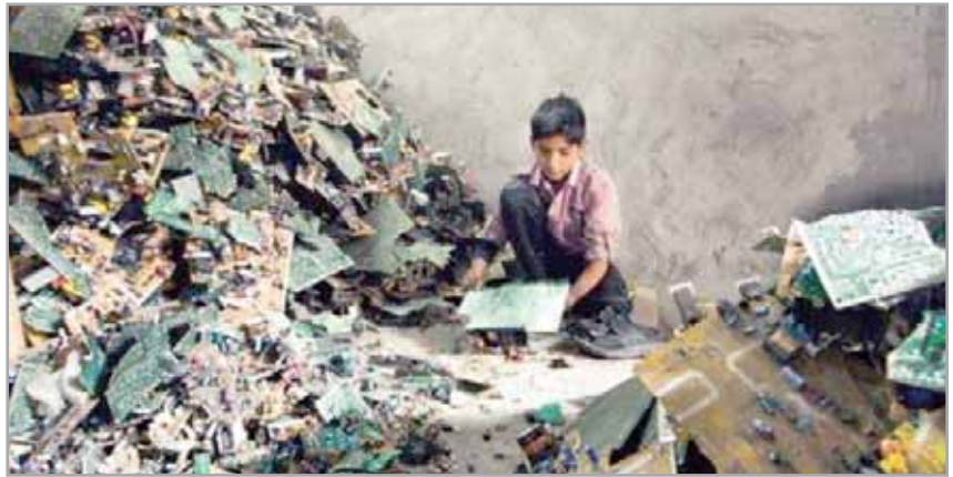
النفايات تسبب أضراراً للبيئة وتؤدي إلى التسمم