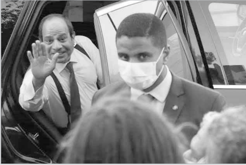
الرئيس يلتقى مواطنين بالبرويست ويستمع لمطالبهم

« ثوابت الدين لن تتغير ولكن يجب فهم التطور الإنساني في التعامل