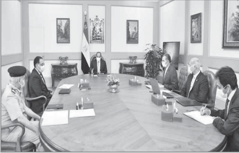
توجيهات رئاسية خلال استعراض تقرير صندوق تكريم الشهداء

نسبة العجز من أموال الصندوق من خلال الجهات المعنية؛ كلا فيما يخصه. وبدأ الجهاز المركزي للتنظيم والإدارة في اتخاذ إجراءات تعيين المستوفين لشروط شغل الوظائف من أسر ضحايا ومصابي العمليات الإرهابية من المدنيين بالجهاز الإداري بالدولة، بالتنسيق مع وزارة التضامن الاجتماعي دون الحاجة لتعديل قرار رئيس مجلس الوزراء رقم (2804) لسنة 2017 بشأن قواعد شغل الوظائف العامة للفئات المنصوص عليها بالفئتين الثانية والثالثة من المادة (13) من قانون الخدمة المدنية. وتخصص وزارة الشباب والرياضة في إطار مبادرة «دراجتك - صحتك» دراجة هوائية واحدة لأسرة الشهيد أو الضحية أو المفقود أو المصاب من الراغبين على أن يتحمل الصندوق نصف ثمن الدراجة ويتحمل المستفيد النصف، وقام الصندوق بتسليم المرحلة الأولى من الراغبين من القاهرة والجيزة بواسطة وزارة الشباب والرياضة. ويتم تسليم بطاقات التكريم للمستفيدين من القانون (16) لسنة 2018 شهر أكتوبر المقبل بالتنسيق مع الوزارات المعنية بعد صرف التعويض المادي مع قيام الوزارات بتوزيعها على المستفيدين وموافاة الصندوق بتمام التنفيذ.