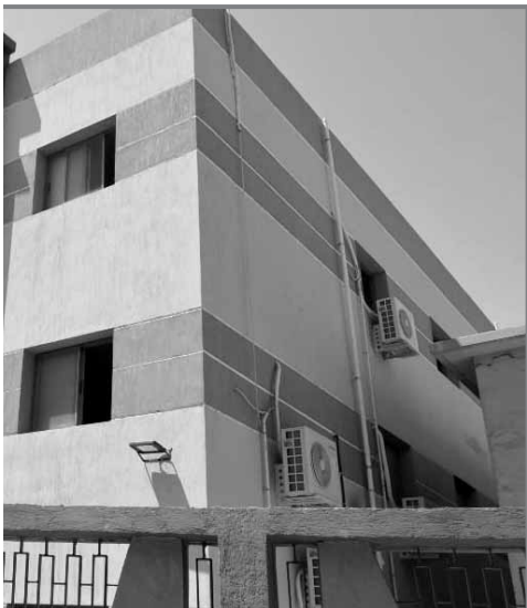
وحدات متطورة لطب الأسرة