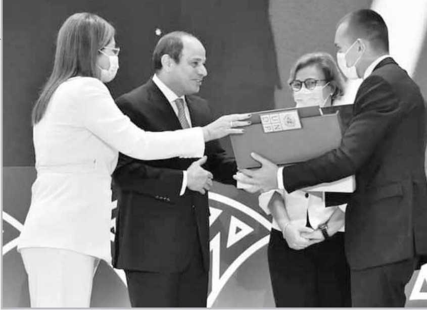
تقرير التنمية البشرية أكد نجاح التجربة التنموية المصرية

التطورات المتلاحقة التي تشهدها المنطقة، وتعزيز وحدة الصف في مواجهة مختلف التحديات الإقليمية.