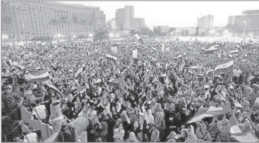
حروب الجيل الخامس بعد ثورة 30 يونيو

في مرحلة سابقة كانت الزوايا أسفل العقارات سبباً رئيسياً وراء تطرف الشباب، وكنا كجهاز أمنى نعانى من هذه الظاهرة، لوجود قانون يعضى مالك العقار من «العوايد» إذا بنى زاوية أسفل العقار، وكانت مديرية الأوقاف لها قوانينها التى تمنع ضم الزوايا لإشرافها لعدم توافر شروط المسجد فيها، والنتيجة ضغط وأعباء على كاهل الأجهزة الأمنية فى مواجهة جماعات التطرف وأفكارهم، والذين كانوا يتخذون من الزوايا مراكز لنشاطهم.