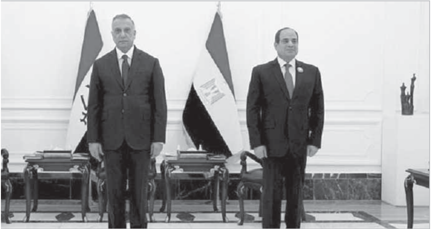
قمة بغداد الأخيرة.. الدولة المصرية حاضرة

« 70 اتفاقية مع 5 دول منذ بداية العام.. وشركات المقاولات المصرية تنفذ م