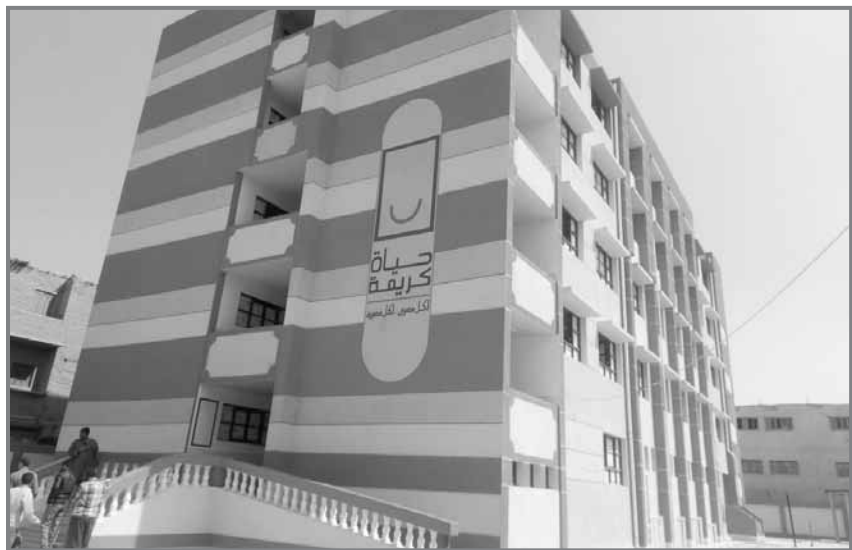
المدارس الجديدة في القرى الأولى بالرعاية