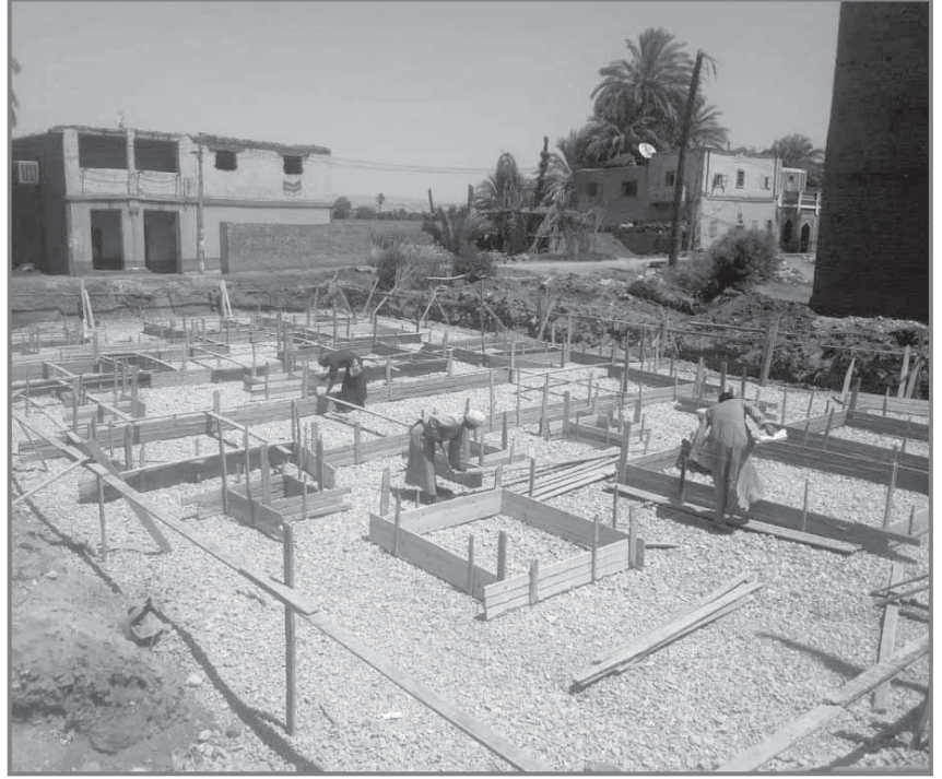
عمل لايتوقف لحياة أفضل

ورفع كفاءة مبانى الوحدات المحلية والصحية والمدارس ومراكز الشباب واحلال وتجديد بعضها، وإنشاء ملاعب جديد خماسي منجلة وتدعيم القرى بمحولات كهرباء وأعمدة إنارة بالطاقة الشمسية وإنشاء خزانات مياه أرضية، وشبكة خزانات صرف صحي لا هوائى من دون مصرف بأربع قرى، ورفع كفاءة مداخل القرى وبناء 134 منزلًا بالقرى الخمسة.