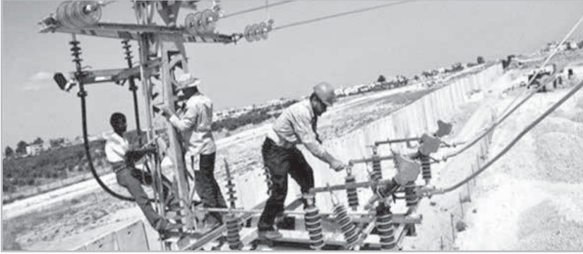
ربط الكهرباء بالعراق.. مشروع تكامل عربي

وحسب المقرر تستفيد شركات المقاولات المصرية من الاتفاقيات في هذا المشروع، لتعزيز أعمالها في الدول العربية. من جانبها قدرت مؤسسة راند البحثية الأمريكية، فوائد التكامل الاقتصادي بين بلاد الشام بزيادة تتراوح ما بين 3 إلى 7% في الناتج المحلي الإجمالي لهذه الدول، مشيرة إلى أن هذا التوسع قد يخلق ما لا يقل عن 700 ألف إلى 1.7 مليون فرصة عمل إضافية، مما يقلل من معدلات البطالة الإقليمية بنسبة من 8 إلى 18%.