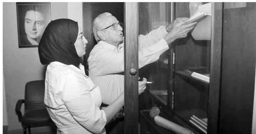
على بدرخان وأسرار كثيرة فى مكتبته

«سعاد حسنى زوجة عادية جداً.. لكن خجولة» «لم أقدم أى فيلم من أجل «أكل العيش»» «لو لم أكن مخرجاً لأصبحت ضابطاً بحرياً»