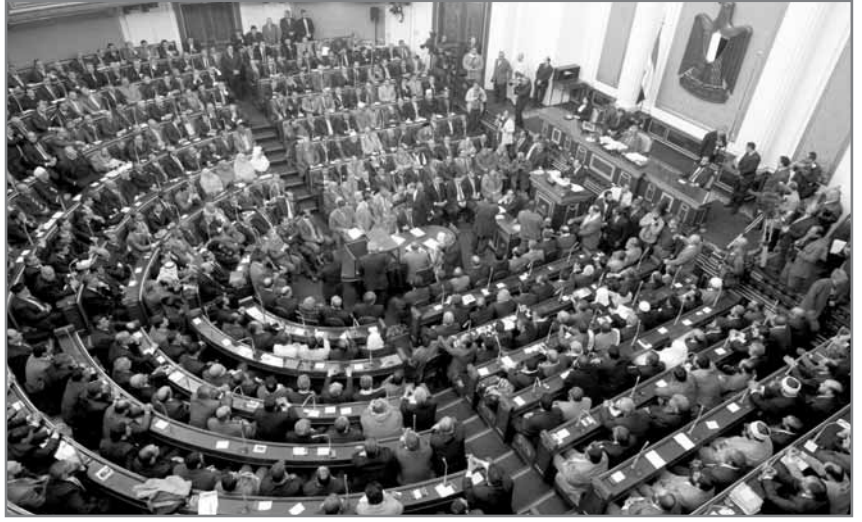
اعتماد مجلس الشيوخ مشروع قانون الصكوك السيادية

وقال أستاذ الاقتصاد الدولى: تساهم تلك الصكوك فى فتح آفاق استثمارية جديدة، مما يعنى الاقتصاد المصرى، مما ينعكس إيجابا على الموازنة العامة للدولة، حيث يزدهر النشاط الاقتصادى، وتوسع قاعدة