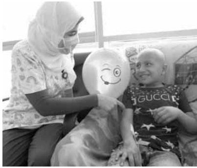
السعادة والبهجة تسرع التعافي والشفاء

تمريض مستشفى 57357: لا يقتصر دور الممرضة على تجهيز الدواء وإعطائه للمريض، بل هي عضو أساسي مشارك في كل اللجان العلاجية التي يتم تكوينها لمباشرة علاج كل أنواع السرطان، فمثلاً يوجد طبيب وصيدلي في اللجنة يوجد ممرض أيضاً، كذلك اللجان لتقديم أوراق بحثية بالمستشفى تكون الممرضة أحد أعضاء الفريق المشارك فيها. كذلك بنك الدم وكل ما يتصل به يكون ممثل قسم التمريض أحد المشاركين وصاحب قرار.