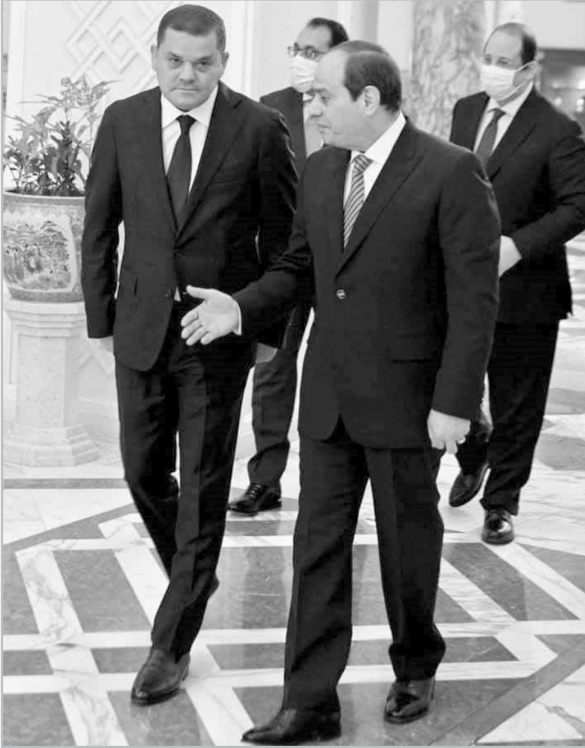
تأكيد مصرى على رفض التدخل الخارجى فى الشئون الليبية

جهودها للتنسيق مع جميع الأشقاء الليبيين خلال الفترة المقبلة، بما يساهم فى ضمان وحدة وتماسك المؤسسات الليبية، وصولاً إلى إجراء الاستحقاق الانتخابى برلمانيا ورئاسيا المنتظر، فضلا عن منع التدخلات الخارجية التى تهدف بالأساس إلى تنفيذ أجنداتها الخاصة على حساب الشعب الليبى، وكذا إخراج جميع القوات الأجنبية والمرتزة من الأراضى الليبية.