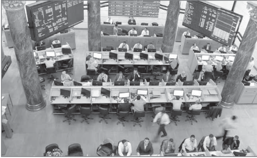
التحفيز لزيادة الطلب على الأوراق المالية

يمكن تعريف الصكوك السيادية بأنها أوراق مالية حكومية، بقيم نقدية متساوية لكل منها، تصدرها الدولة لمدد محددة، تتراوح بين عام و 30 عاما، بهدف تمويل البنية التحتية من المشروعات الاقتصادية، والتنمية، والاستثمارية، للنهوض بجميع محاور التنمية المستدامة، وتمويل عجز الموازنة العامة للدولة، من خلال خطط استراتيجية توازن بين الاستدانة من البنوك الداخلية وسداد الدين الخارجى، ويتم احتساب العائد الاستثمارى بقيم ثابتة فى الأذون والسندات والأسهم، أو متفاوتة حسب الربح والخسارة، وهى التى تعرف بالاستثمار على الشريعة الإسلامية.