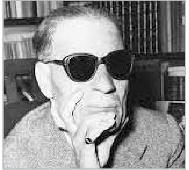
د. طه حسين

وقال موسى للعميد: وهل هذا معقول؟ لست مثله مفلوت اللسان! وضحك طه حسين وسيضحك اليوم أنيس منصور شامتاً فى أستاذنا طه حسين!