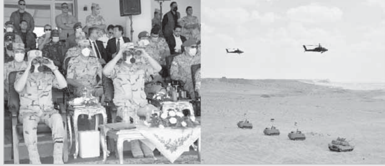
ختام النجم الساطع 2021 بقاعدة محمد نجيب العسكرية