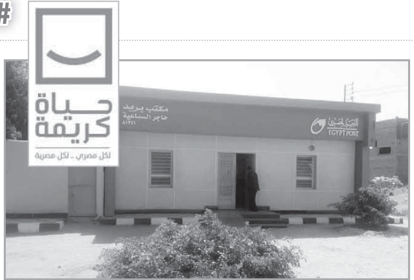
توفير الخدمة البريدية والبنكية فى قرى حياة كريمة

وتم إنشاء وتوسعة 18 مدرسة، كل منها تضم 5 طوابق بسعة 15 فصلاً، وتسع 600 طالب، منها: قلهانة الإعدادية، و(أهرت، عزبة عبدربه، القرية الثانية، الشهيد أحمد عبدالعزيز بنين، أبو صير، الجراى، الشهيد عمرو محمد دهشان قلمشاة الجديدة، الفرق الجديدة، عبدالكريم عبدالمجيد) للتعليم الأساسى، و(منية الحيط، حامد خليفة، سيف النصر قبلى) الابتدائية، ومدرسة الفرق لغات. وجار دراسة صلاحية مواقع 27 مدرسة