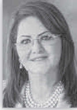
هالة السعيد النمو السكانى