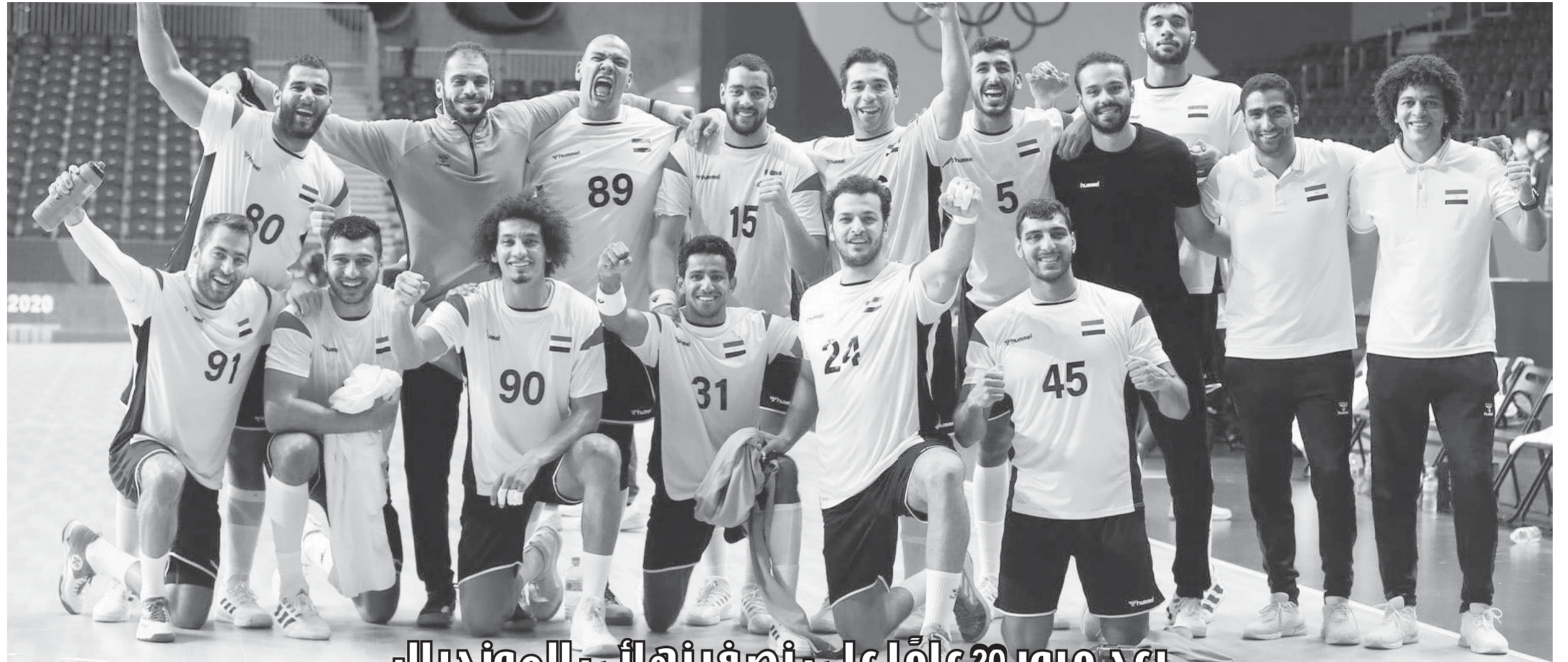
بعد مرور 20 عامًا على نصف نهائي المونديال