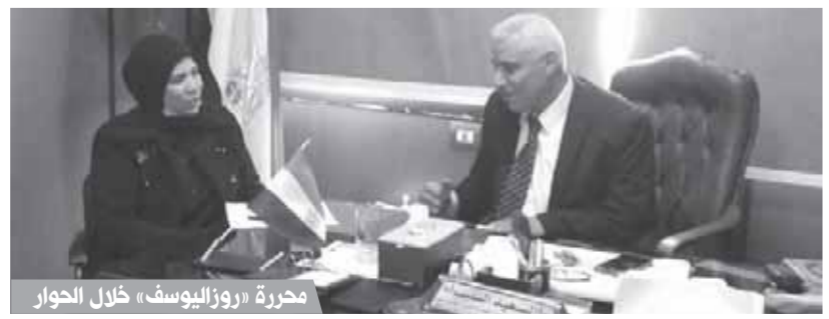
محررة «روزاليوسف» خلال الحوار