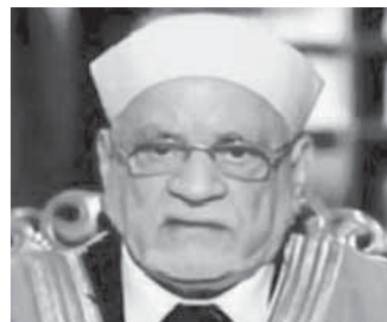
كتب- صبحي مجاهد

أعلن الدفاع المدني بقطاع غزة أنّ عدد الشهداء في القطاع جراء القصف الإسرائيلي ارتفع إلى 139 شهيداً، بينهم 39 طفلاً و22 امرأة، وأشار الدفاع المدني إلى ارتفاع عدد الضحايا جراء قصف منزل في مخيم الشاطئ بغزة إلى 10 شهداء، بعد انتشار جنثي طفلين. بدورها أعلنت وزارة الشؤون الدينية الفلسطينية أنّ الطيران الإسرائيلي دمر مسجداً، وقال المتحدث العسكري الإسرائيلي: إن الجيش يتحرى صحة هذا الخبر. ومع عدم وجود علامة على انتهاء القتال امتدت الخيائير إلى أماكن أبعد مع إعلان الفلسطينيين سقوط 11 شهيداً في الضفة الغربية المحتلة وسط اشتباكات بين محتجين وقوات الأمن الإسرائيلية. أعلنت وكالة الأمم المتحدة لإغاثة وتشغيل اللاجئين الفلسطينيين «الأونروا»، السبت، بدء تحويل مدارسها المجهزة في غزة، إلى ملاجئ تستوعب من تضررت منازلهم من جراء القصف الإسرائيلي، مع وصول عدد النازحين إلى نحو 10 آلاف فلسطيني.