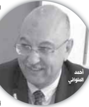
الدولة تسعى لتقليل زمن الإفراج واستخدام المنظومة الرقمية

«الملوانى» يستعرض عدداً من الملاحظات والمقترحات