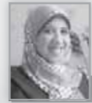
كتبتها - أسماء عبد الخالق

«وَحِينَ تَمُرُّ عَلَى لِحَظَاتٍ مِنَ السَّعَادَةِ، كُنْتُ أَفْكَرُ بِأَنْي لَوْ اسْتَطَعْتُ إِهْدَاكَ هَذَا الشُّعُورِ مَا تَرَدَّدْتُ، مَا تَرَكْتُكَ وَحِيدًا هَكَذَا، وَحِينَ تَمُرُّ عَلَى أَيَّامٍ ثَقِيلَاتٍ أُرَدُّ بِعَدَلَةِ اللَّهِ اسْمَكَ، وَاحْضِنِ نَفْسِي فِيكَ بِصَمْتٍ كِي أَغْفُو وَأَهْدَأُ، وَحِينَ تَغْلِبُنِي الدَّمُوعُ وَأَشْعُرُ بِالْمَقْدِ أَحْبَبْتُ عَنْ أَيِّ شَيْءٍ يَذْكُرُنِي بِكَ رَغْمَ أَنْي لَمْ وَلَنْ أُنْسَاكَ، فِي أَنْتِظَارِ عَوْدَتِكَ.. أَتَعْرِفُ..؟ أثناء ذهابي إلى العمل ودون سابق إنذار انتهت إلى صوت نجاة الصغيرة يخرج من المدنيان يردد.. يغيب القمر ويطل القمر