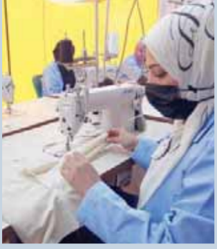
مشروع العربة المتنقلة لتدريب الفتيات على مهنة الخياطة