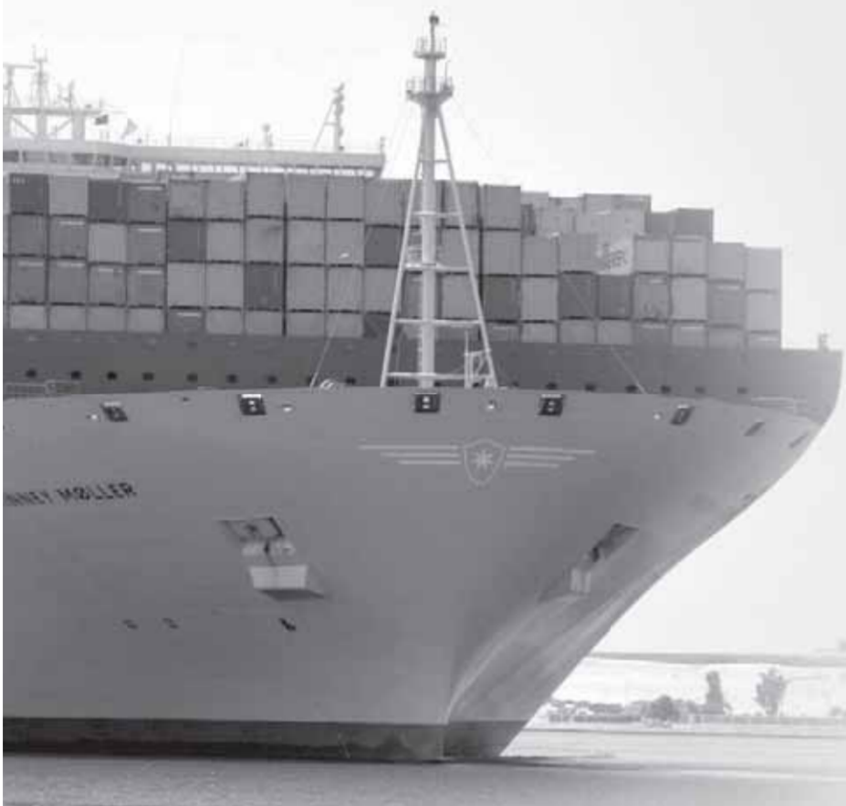
صرف المستحقات المتأخرة من «دعم الحكومة للشركات المصدرة» المنضمة للمرحلة الثانية على 3 مراحل قبل نهاية فبراير وقبل نهاية أبريل وقبل نهاية يونيو

إقبال ملحوظ على الانضمام للمرحلة الثانية من مبادرة «السداد النقدي الفوري لدعم الحكومة للمصدرين»