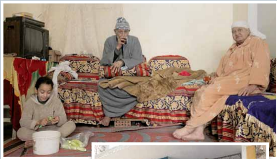
رفع كفاءة 12 منزلا لمحدودى الدخل