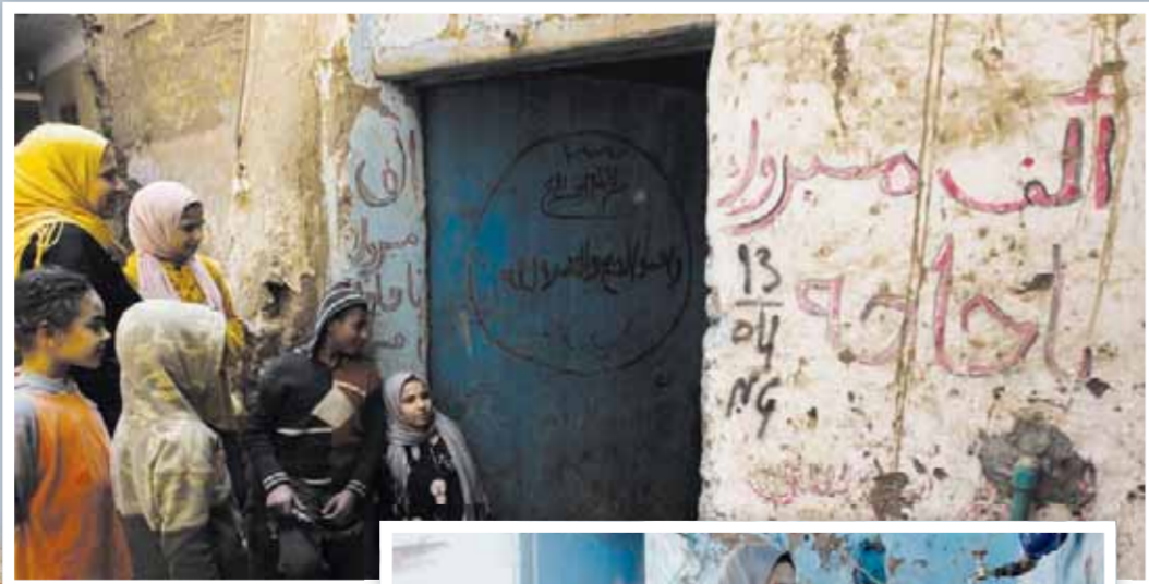
إحلال وتجديد شبكات الكهرباء ومياه الشرب