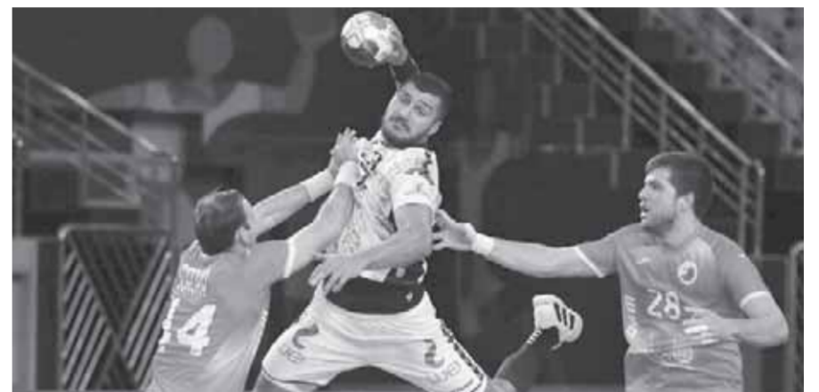
كتبت - فاطمة التابعي

يخوض المنتخب الوطني لكرة اليد رجال اليوم الجمعة ثاني مبارياته في إطار منافسات المجموعة الرابعة من الدور الرئيسي لبطولة العالم ٢٧ لكرة اليد رجال «مصر ٢٠٢١». أمام منتخب بيلاروسيا، ويقام اللقاء في تمام الساعة السابعة من مساء اليوم على صالة ستاد القاهرة وتعد مباراة المنتخب الوطني أمام منتخب بيلاروسيا مباراة متوازنة القوى التي حد ما ولكنها تحتاج المزيد من التركيز من المنتخب الوطني بقيادة الأسباني روبرتو جارسيا بارونديو ولإعينا لتحقيق الفوز الثاني في المجموعة بعد الفوز على روسيا في المباراة الأولى ٢٨/٢٣. وكانت باقى مباريات الجولة الأولى لتلك المجموعة قد أسفرت عن تعادل السويد وبيلاروسيا ٢٦/٢٦، وفوز سلوفينيا على مقدونيا ٢١/٢١، وعقب مباريات الجولة الأولى في المجموعة الرابعة بالدور الرئيسي «مجموعة مصر» أصبح ترتيب المجموعة كالتالي منتخب السويد الأول برصيد ٥ نقاط، منتخب مصر ثاني برصيد ٤ نقاط وهو نفس رصيد المنتخب السلوفيني الذي يحتل