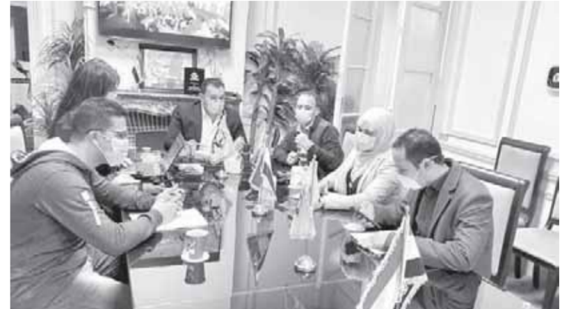
غرفة عمليات تنسيقية شباب الأحزاب

استعدادات حزب الوفد للانتخابات لإعادة لمجلس النواب وأكد بدرأوى أن الحزب له 6 مرشحين في إعادة، ومن بينهم مرشح واحد خلال إعادة المرحلة الأولى. وتابع: «إن الحزب سيقود حملة لتوعية المواطنين في الدوائر الانتخابية والتحذير من خطر استخدام المال السياسي وشراء الأصوات وأن هذا الأمر يفرز مجلسا لا يعبر عن المواطن». ومن جانبه قال اللواء محمد على بلال أمين عام حزب حماة الوطن «إننا نعمل وفق خطة محددة لمتابعة سير عملية انتخابات مجلس الشيوخ، وتم تشكيل غرف عمليات في المحافظات لترفع تقارير بشكل مستمر للفرقة المركزية لإزالة أي عقبات قد تواجه الناخبين أو المرشحين في الانتخابات». ولفت إلى أن أمانات الحزب في المحافظات تعمل على تسهيل عملية نقل الناخبين في المناطق النائية لمقار اللجان وتأتيه وإجهم الدستوري، مشيراً إلى أن المشاركة في الانتخابات تؤكد رغبة المصريين في الإصلاح الوطني.