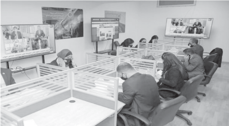
غرفة عمليات الشعب الجمهوري

مستقبل وطن: التزام بالإجراءات الاحترازية وتكثيف عمليات التطهير أمام اللجان