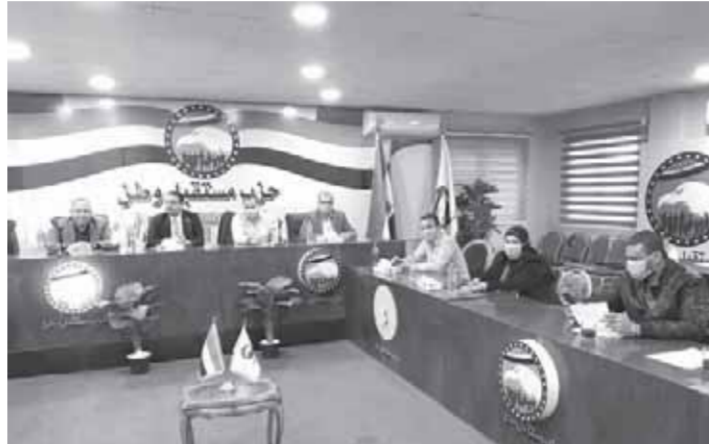
غرفة عمليات مستقبل وطن