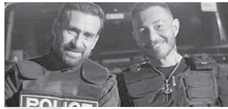
مشهد من فيلم «زنزانة 7»

تنتعش بشكل كبير وخلال الفترة المقبلة من المقرر أن تعود إيرادات السينما لما وصلت إليه قبل جائحة كورونا، لذلك أعتقد ان صناع الأعمال السينمائية قد أكلوا طرح أفلامهم بسبب انتظار الوقت المناسب وعودة دور العرض لكافة طاقاتها، وأشار قاسم أن عدد كبير من المنتجين قرروا أن يطرحوا أعمالهم خلال الأيام المقبلة لعدم الدخول فى الزحام الذى يشهده موسم رأس السنة والذى من المتوقع أن يعود من خلاله نجوم شباك السينما المصرى، مؤكدا أن هذا الأمر يسير فى إطار تحسن السينما المصرية.