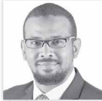
هاشم بن عوف

وخلال الجولة تفقد منار مواقع الطائرات وأماكن الصيانة كما تابع انتظام سير العمل وأعمال صيانة الطائرات والخدمات الفنية التي تقدم للعملاء من شركات الطيران المختلفة مؤكدا على ضرورة الالتزام بتقديم أعلى معايير الجودة الفنية والعالمية لجميع العملاء، واطمأن الوزير على الالتزام بتطبيق كل الإجراءات الاحترازية والوقائية للحفاظ على سلامة وصحة العاملين، كما حث الوزير العاملين بشركة الصيانة على ضرورة بذل أقصى جهد لرفع مستوى الأعمال الفنية وخدمات الصيانة المقدمة بما يليق بمكانة ومستوى الشركة الوطنية. وفي نهاية الجولة أشق وزير الطيران على المستوى المتميز للمنتصر البشري داخل الشركة والذي يعد أهم العناصر الأساسية والفعالة لازدهار الشركة، مشيرا إلى أن الشركة تسعى خلال الفترة القادمة على العمل نحو زيادة الإنتاج وتحقيق ربحية عالية واستقطاب مزيد من العملاء الجدد من خلال التوسع داخل الأسواق العالمية والعمل على زيادة القدرة التنافسية بشكل دائم ومميز. من ناحية أخرى أجرى الطيار محمد منار وزير الطيران المدني مكالمات هاتفية مع المهندس هاشم بن عوف وزير الدولة للبنية