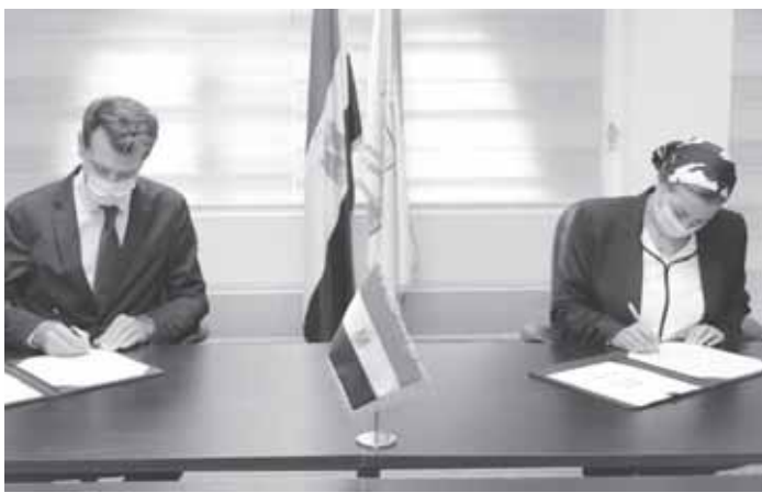
ياسمين فؤاد وزيرة البيئة وألكسندر فرومان الرئيس التنفيذي لشركة فودافون مصر

وقعت الدكتورة ياسمين فؤاد وزيرة البيئة وألكسندر فرومان الرئيس التنفيذي لشركة فودافون مصر بروتوكول تعاون للمشاركة في الأنشطة والمشروعات البيئية المختلفة التي تقوم بها الوزارة لحماية البيئة المصرية ورفع الوعي البيئي، وذلك في إطار حملة اتحضر للأخضر لنشر الوعي البيئي التي أطلقتها الدكتورة ياسمين فؤاد تحت رعاية رئيس الجمهورية. وأكدت الدكتورة ياسمين فؤاد وزيرة البيئة أن التعاون بين وزارة البيئة وشركة فودافون يبدأ بمجال المخلفات من خلال مشروع E-Tadweer لتدوير المخلفات الإلكترونية والتخلص الآمن منها والتي من ضمنها أجهزة المحمول التالفة، والتي تعد من المخلفات الخطرة التي تؤثر على صحة المواطن