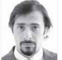
بقلم - باسم توفيق

وتميزت هذه المدرسة أيضا بتقنيات لونية رائدة اعتبرت فيما بعد منهجا تقنيا للأجيال اللاحقة ونستطيع أن نقول أيضا إن هذه المدرسة كانت أكثر رحابة من المدارس الأخرى بحيث أعطت الأماكن الهواء الطلق متنفسا داخل أعمالها، وبذلك كانت قد سبقت العديد من المدارس الأخرى في الخروج من الأماكن الضيقة ما بين أجنحة الحرم وقصور الطبقة الغنية بل والأماكن التي وصفت بأنها أكثر جديا لأعمال المستشرقين مثل أماكن العبادة وغيرها.