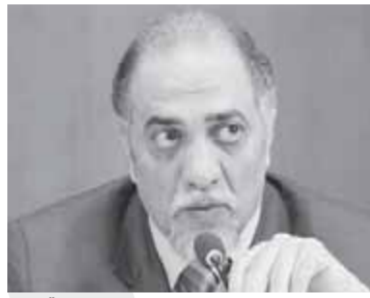
عبد الوهاب القصبى

ثورة ٣٠ فعلى الصعيد الاقتصادي بالنسبة لإيرادات قناة السويس تراجعت من ٥.٢ مليار دولار في عام ٢٠١٢/٢٠١١ إلى ٥ مليارات دولار فقط عام ٢٠١٣/٢٠١٢. وبرغم التشكيك في إنجاز قناة السويس الجديدة استطاعت القناة تحقيق إيرادات بلغت ٥.٩ مليار دولار، خلال العام المالي ٢٠١٨/٢٠١٩، وهي الأعلى في تاريخ القناة. وأكد نائب رئيس حزب الوفد، أنه وصل عدد السياح قبل جائحة كورونا إلى ١٢.١٢ مليون سائح عام ٢٠١٢/٢٠١٣ وهو معدل أقل من العام السابق له عندما بلغ ١٥.٩٥ مليون سائح خلال عام ٢٠١٢-٢٠١١ بينما بلغ إجمالي السائحين عام ٢٠١٩ نحو ١٢ مليوناً و٢٦ ألف سائح، برغم الصعوبات الأمنية والحرب على الإرهاب سواء في سيناء أو في المنطقة الغربية. وزاد الهضيبي: ما تم من إنجازات ساهمت في تخفيض عدد حوادث الطرق، وهو ما يوضح أن الاهتمام بالطرق بالإضافة إلى إنشاء شبكة طرق ذات مواصفات عالمية أدت