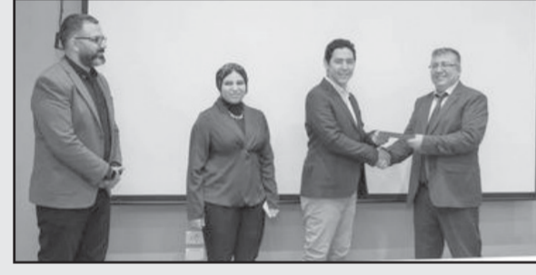
40 يوم في العناية المركزة، مما يجعل هذه الوحدات مكوناً أساسياً في رحلة العلاج، وأعتبرت عن إمتانتها وكافة القائمين على المشروع على مساهمة شركة المستقبل للتعمية العمرانية في دعم هؤلاء الضحايا من خلال هذا التعاون. وأضاف: «أنا في مؤسسة أهل مصر لا يسعنا إلا أن نشكر شركة المستقبل على دعمهم لنا، وانتقل إلى مزيد من التعاون منهم ومن غيرهم من المؤسسات للمساهمة في إستكمال تجهيز مستشفى أهل مصر لعلاج الحوادث والحروق بالمجان».

أتمت شركة المستقبل للتعمية العمرانية المالك والمطور العام لمشروع «مستقبل سيتي» بالقاهرة الجديدة التبرع لمؤسسة «أهل مصر للتعمية» من خلال التبرع تجهيز عدد (3) غرف مراقبة عناية مركزة بمستشفى أهل مصر لعلاج الحوادث والحروق بالمجان، الجارى تجهيزها الآن بالقاهرة الجديدة. وقام وفد من شركة المستقبل بعمل جولة تفقدية بموقع تطوير المستشفى التي تقدر إجمالي مساحتها ١٢.٢٠٠ متر مربع وقد صممت بطاقة استيعابية 201 سرير، وتم تنفيذ الأعمال الإنشائية وتم عرض كافة مستجدات خطة التطوير بالمستشفى من قبل مدير إدارة المشروع وممثل المؤسسة. وتعليقاً على هذا التبرع قال المهندس عصام ناصف رئيس مجلس الإدارة والعضو المنتدب لشركة المستقبل للتعمية العمرانية بأن هذا التبرع هو استكمالاً لعزم الشركة على تفعيل دورها المجتمعي خاصة أن مؤسسة أهل مصر للتعمية، هي أول مؤسسة في مصر والشرق الأوسط وأفريقيا ركزت جهودها ضد مخاطر الحوادث والحروق من خلال العلاج والتوعية والوقاية لضحايا الحوادث والحروق بمفاهيم عالمية متكاملة. من جانبها، أوضحت د. هالة السعيد، مؤسس ورئيس مجلس أمناء مؤسسة أهل مصر للتعمية، أن الضحية الواحدة تقضى أكثر