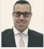
أحمد باشا يكتب: